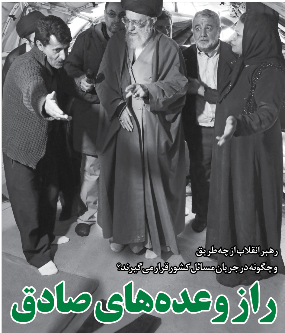
رهبر انقلاب از چه طریق و چگونه در جریان مسائل کشور قرار می‌گیرند؟

به دو گزاره‌ی فوق، باید این گزاره را هم اضافه کرد که برای رسیدن به تحلیل درست، باید در میدان بود و از نزدیک، مشکلات را لمس کرد. یک مسئول اجازه نمی‌دهد فاصله و رابطه‌اش با مردم کم بشود. رهبر انقلاب خود تأکید دارند که «معتقدم که برای یک مسؤول در دستگاه حکومتی - اعم از مسؤولیتی که بنده دارم یا مسؤولیتی که دیگر مسؤولان دارند - انقطاع از واقعیات و دوری از مردم، عامل انحطاط است... حضرت به مالک اشتر فرموده‌اند: قلّه علم بالأمور؛ به خاطر احتجاب و دوری از مردم، آگاهی انسان از همه چیز کم می‌شود. البته من به خانه‌های اشخاص هم می‌روم. یکی از کارهایی که بحمدالله من از اوایل ریاست جمهوری تا به حال انجام داده‌ام - البته گاهی بیشتر است، گاهی کمتر - این است که به منازل اشخاصی از آحاد و توده‌های مردم می‌روم، روی فرش‌شان می‌نشینم، با آنها حرف می‌زنم و زندگی‌شان را از نزدیک لمس می‌کنم.» ۷۹/۱۲/۹۶ یکی از وزرای وقت اواخر دهه‌ی هفتاد در حوزه‌ی صنعت نیز تعریف می‌کرد که "در سالی که قیمت فولاد در جهان به تعبیر خود اهل فولاد به دره‌ی مرگ افتاده بود و واردات نیز خیلی گسترش پیدا کرده بود، طوری که شرکت‌های تولیدکننده ضرر می‌کردند، در همان ایام و در یکی از شب‌های اعیاء، یکی از مسئولان دفتر رهبری با من تماس گرفت و گفت که آقای نگران هستند و گفتند بیایین جا شب اعیاء بود و این موضوع برای من خیلی عجیب بود، زیرا معمولاً آقایان در شب اعیاء برای خود برنامه‌های خاصی دارند و معمولاً به هر کاری نمی‌پردازند. من فکر می‌کردم در این شب دیگر ایشان حال و هوای این حرف‌ها را نباید داشته باشند." اما کار مردم واجب بود. ۳