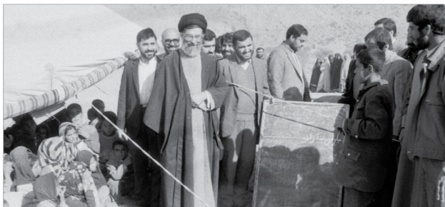
بازدید حضرت آیت‌الله خامنه‌ای رییس جمهور وقت از مدرسه عشایری استان فارس ۲۳ آذر ۱۳۶۷

سؤال: آیا هنگام فروش ماشینی باید تمام عیب و نقص‌های آن به خریدار گفته شود و در صورتی که نگوئیم معامله صحیح است؟ جواب: گفتن عیب واجب نیست، اما نباید عیب آن را مخفی کند یا دروغ بگوید و معامله صحیح است، ولی اگر مشتری عیب را نداند و بعد از معامله بفهمد، حق فسخ معامله یا دریافت ازش را دارد. سؤال: گرفتن چه مقدار سود در فروش کالا مجاز است؟ جواب: سود گرفتن حد معینی ندارد، بنا بر این تا وقتی که به حد اجحاف نرسیده و بر خلاف مقررات دولت هم نباشد، اشکال ندارد، ولی افضل بلکه مستحب آن است که فروشنده به آن مقدار سودی که هزینه‌هایش را تأمین می‌کند، اکتفا نماید. ●