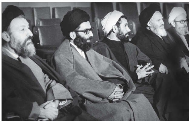
انتشار به مناسبت شهادت شهید باهنر

همان چیزی است که در قانون اساسی آمده است. رهبری، سیاستگذار کلی نظام محسوب می‌شود؛ یعنی همه قوای سه‌گانه باید در چارچوب سیاست‌های رهبری برنامه‌ریزی کنند و سیاست‌های اجرایی خودشان را تنظیم نمایند. حرکت و قواره‌ی کلی نظام باید در چارچوب سیاست‌هایی باشد که رهبری معین می‌کند. این مهم‌ترین مسؤولیت رهبری است. ۷۹/۱۲/۲۲ وظیفه‌ی رهبری آنجایی است که احساس کند یک حرکتی دارد انجام می‌گیرد که این حرکت، مسیر نظام را دارد منحرف می‌کند. اینجا وظیفه‌ی رهبری است که بیاید در میدان و به هر شکلی که ممکن است بایستد و نگذارد؛ ولو مورد جزئی باشد. ● ۹۵/۴/۱۲